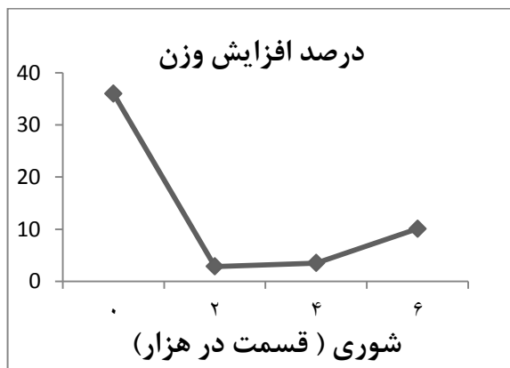
شکل ۳: درصد افزایش وزن بچه ماهیان کپور علفخوار در شوری های مختلف

فاکتور وضعیت (CF) فقط در تیمار شوری ppt ۴ نسبت به بقیه تیمارها افزایش معنی داری را نشان داد، درحالی که مقادیر آن در بقیه تیمارها تقریباً مشابه هم بود (شکل ۲). همچنین مشخص شد که تیمار آب شیرین (ppt ۰) در هفته اول کمترین فاکتور وضعیت را داشته است (شکل ۲).